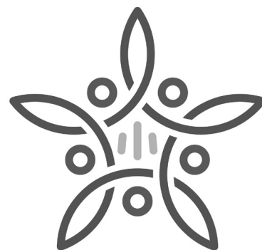
統合新小学校の校章