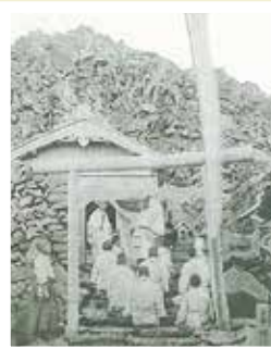
古絵葉書「鳥海山上御本社」(個人蔵)