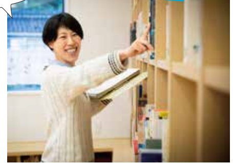
第2期 遊佐町少年町長