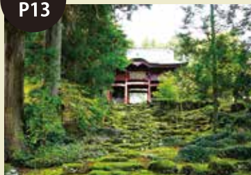
よせんじ 劔龍山 永泉寺

もとは役小角（えんのおづぬ）が鳥海山中腹に道場を開いた7世紀に遡る古刹。境内には荘厳な建造物が建ち並び、数々の文化財が安置されています。最上義光の家臣で亀ヶ崎城代の志村伊豆守の供養塔も。見学無料ですが事前に連絡してください。(0234-77-2122)