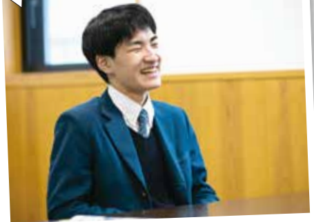
第20期 遊佐町少年町長