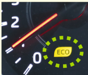
エコドライブランプの例

①エコドライブランプ * を点灯するように運転しましょう。アクセルをふんわり踏んで運転することになり、燃費が良くなります。