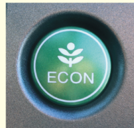
エコドライブスイッチの例

②エコドライブスイッチ * をONにしましょう。車の制御が変わって、ゆっくり加速しやすくなり、燃費が良くなります。